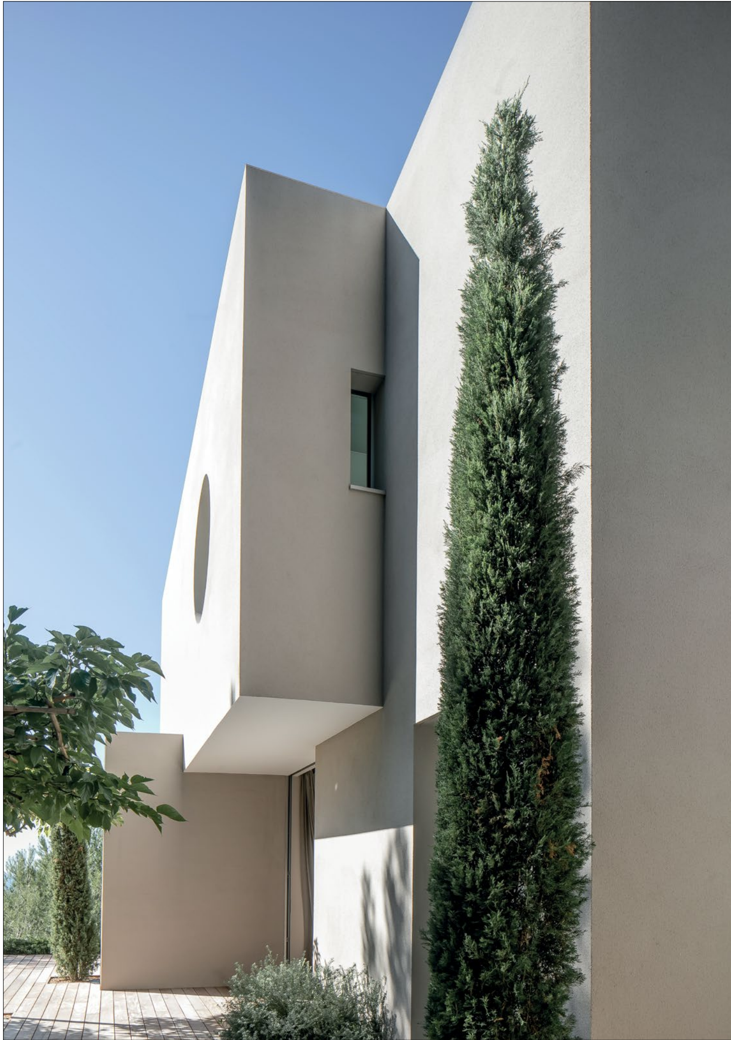
Sur cette double page et la suivante, la villa Ketamine.