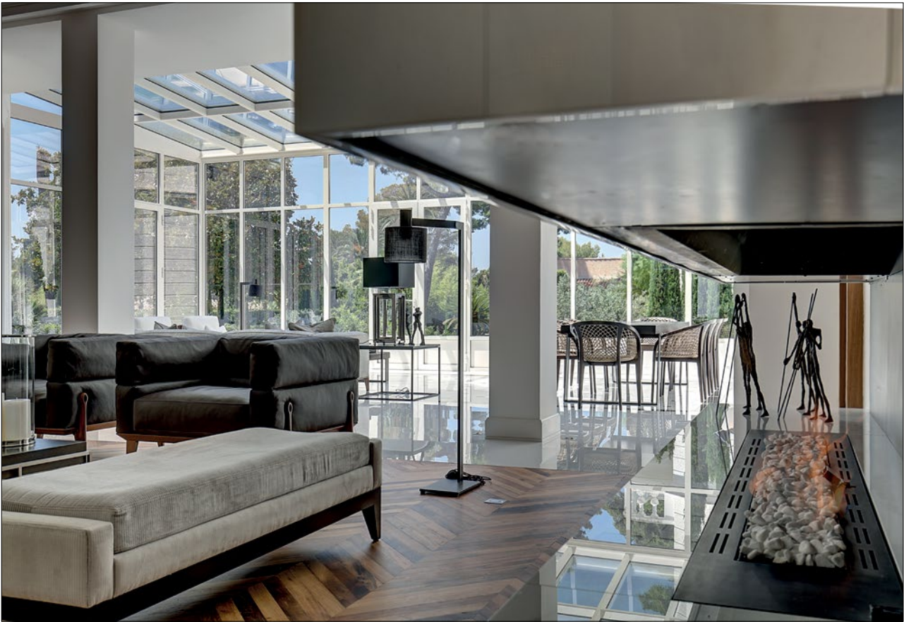
Sur cette page, l'appartement Villa du Cap.