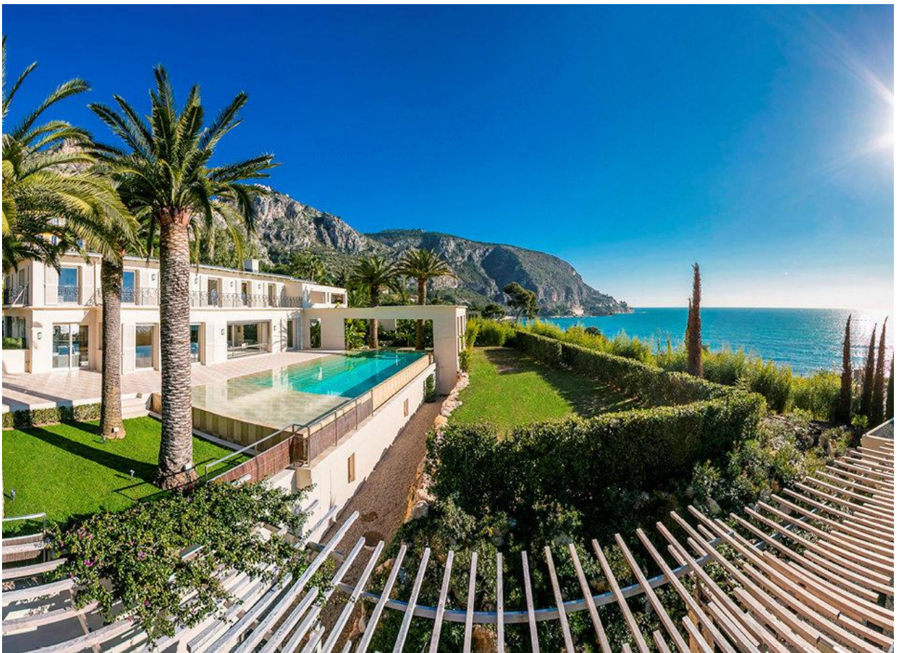
Villa contemporaine, Eze

Style Belle Epoque, villas contemporaines de prestige... D'Eze à Saint-Jean-Cap-Ferrat, ces propriétés sublimes offrent des vues époustouflantes sur la mer.