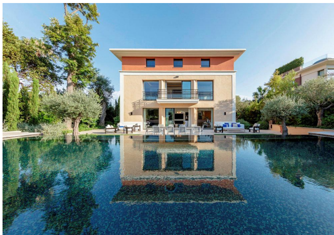
Villa Grevillia, Saint-Jean-Cap-Ferrat