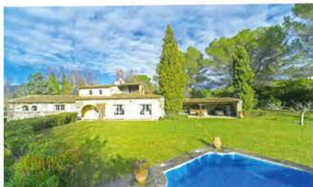
VILLA ST. PAUL DE VENCE 1 590 000 €

Villa de style loft idéalement située au calme et à quelques pas du pittoresque village de St. Paul de Vence. Piscine, maison d'amis et magnifique vue panoramique mer et village. • Loft style villa perfectly located in a quiet and within a walking distance of the picturesque village of St. Paul de Vence. Pool, guest house and magnificent panoramic sea and village views. • Ref. MZISP933