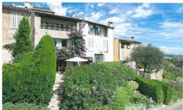
MAISON MOUGINS / VILLAGE 990 000 €

Charmante maison de village d'env. 100 m 2 , avec trois chambres, située en cœur du vieux village de Mougins. Rénovée dans un style chaleureux dispose de 2 belles et grandes terrasses orientées plein sud avec vue ramique. • Charming village house of around 100 sqm, with 3 bedrooms, located at the heart of the old village of Mougins. Entirely renovated in a very atmosphere, it offers 2 beautiful and large terraces facing due south with views. • Ref. MZIMO1546