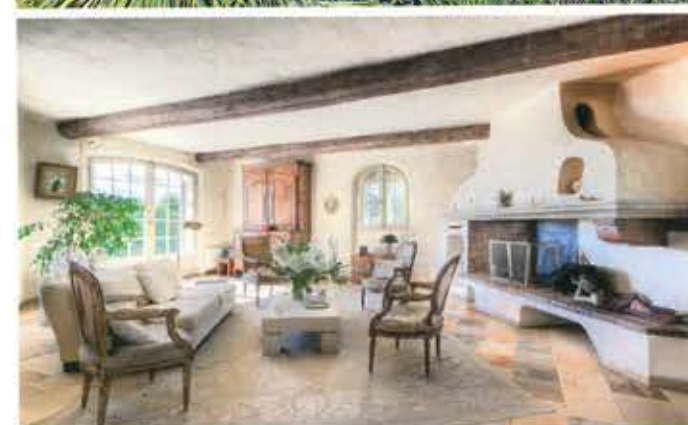
VILLA MOUGINS 1 650 000 €