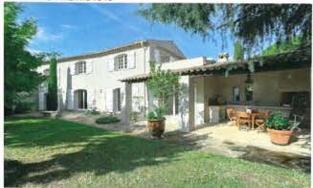
MAISON MOUGINS / DOMAINE FERMÉ 2 300 000 €

Au vieux village, avec vue mer panoramique, ravissante villa provençale d'env. 200 m 2 , rénovée dans un style provençal élégant et lumineux. Elle dispose de 4 chambres dont une suite de maîtres et d'un beau jardin avec piscine et garage. • Walking distance to the old village, with panoramic views down to the sea, charming villa of 200sqm renovated in a bright and elegant provençal style. It offers 4 bedrooms including a master suite, and a garden with pool and garage. • Ref. MZIMO1792