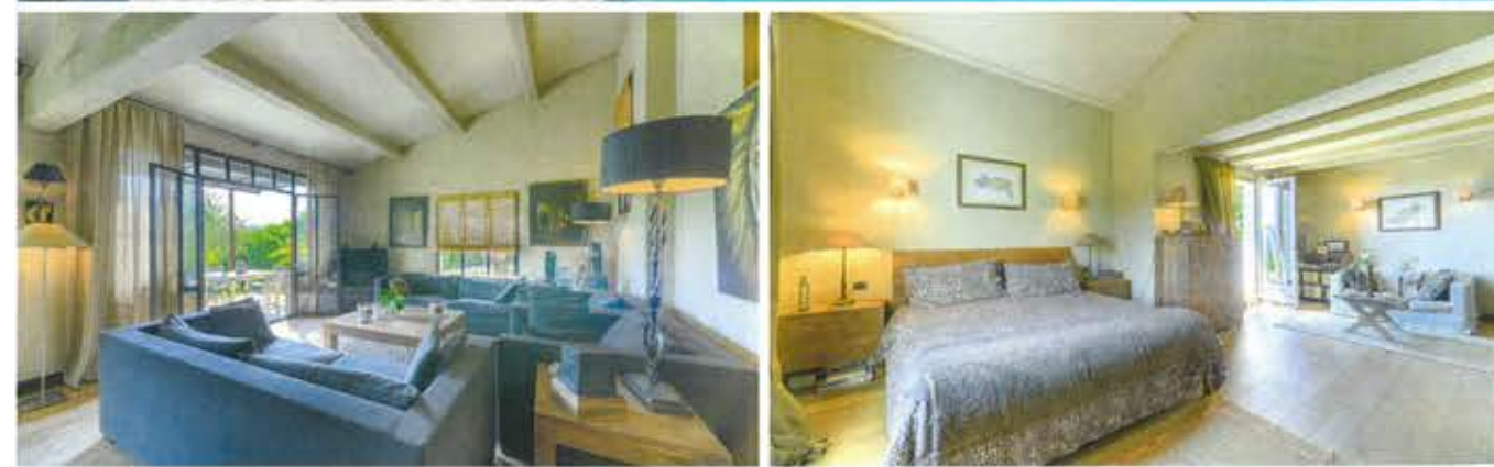
VILLA LA COLLE-SUR-LOUP 1 690 000 €

Au calme, ravissante villa provençale de charme et de caractère à la décoration intérieure raffinée. Elle offre sur environ 200 m 2 , 4 chambres dont un studio indépendant. Très jolie vue dégagée sur le village de St Paul de Vence et agréable espace piscine. A pied des commerces, COS résiduel d'environ 80 m 2 . • Located in a quiet environment, beautiful villa with charm, character and refined interior decoration. On approx. 200 sqm it features 4 bedrooms including a separate studio. Very nice view over the village of St Paul de Vence and nicely fitted pool area. At a walking distance to the shops. Extra building rights of approx. 80 sqm. • Ref. MZISP551