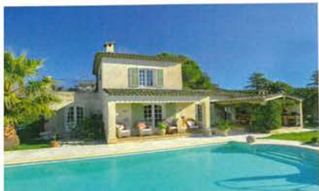
VILLA LA COLLE SUR LOUP 1 250 000 €

Villa provençale récente d'environ 200 m 2 située dans un très bel environnement, au calme et bénéficiant de jolies vues sur la campagne. Grand espace de réception, 4 chambres, agréable cuisine d'été. • Recent and nice provençal style villa of approx. 200 sqm located in a quiet environment and offering lovely views over the countryside. Large reception area, 4 bedrooms, summer kitchen. • Ref. MZISP1101