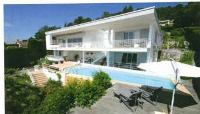
VILLA LA COLLE SUR LOUP 1 495 000 €