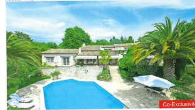
VILLA ST. PAUL DE VENCE 2 150 000 €

Proche du centre ville et au calme total, cette belle villa de style provençal bénéficie d'une vue dégagée sur la campagne. Sur environ 270 m 2 elle comprend 4 chambres plus une maison d'amis. Grande piscine avec pool house aménagé. • Located close to all amenities and in a quiet area, this beautiful Provençal style villa boasts open views on the countryside. On approx. 270 sqm it is composed of 4 bedrooms plus a guest house. Large pool with pool house. • Ref. MZISP1060