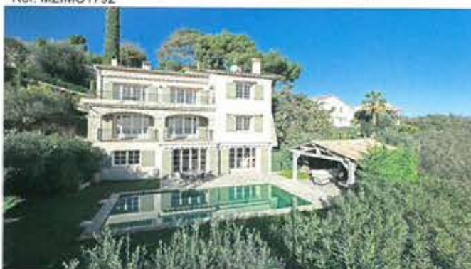
VILLA MOUGINS 2 450 000 €

Un domaine fermé, au calme absolu, ravissante villa provençale d'env. 250 m 2 entièrement rénovée avec de jolis matériaux. Elle dispose de 5 chambres et d'un studio indépendant. Très beau terrain plat d'environ 2600 m 2 avec piscine. • Set in a very quiet area, in a secure and gated domain, beautiful villa of 250sqm fully renovated with beautiful materials. It comprises 5 bedrooms and an independent studio. Nice flat garden of approx. 2600sqm with swimming pool. • Ref. MZIMO1859