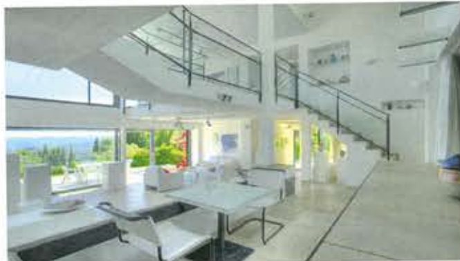
VILLA ST. PAUL DE VENCE 1 880 000 €

Villa provençale récente d'environ 200 m 2 située dans un très bel environnement, au calme et bénéficiant de jolies vues sur la campagne. Grand espace de réception, 4 chambres, agréable cuisine d'été. • Recent and nice provençal style villa of approx. 200 sqm located in a quiet environment and offering lovely views over the countryside. Large reception area, 4 bedrooms, summer kitchen. • Ref. MZISP1101