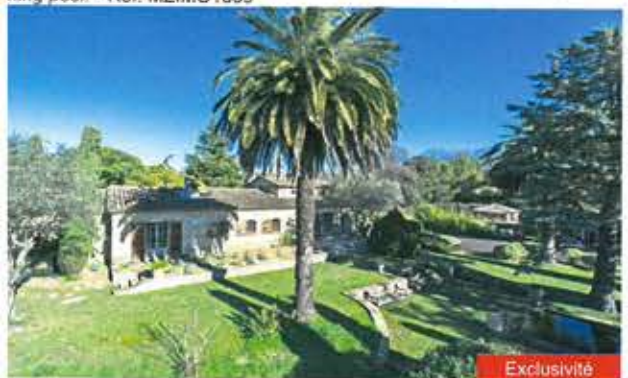
MAISON MOUGINS 2 980 000 €

Domaine résidentiel à proximité des commerces, très belle villa provençale d'env. 380 m 2 jouissant d'une vue mer panoramique, composée de 3 appartements pouvant se relier entre eux. Belle piscine avec pool-house. • Residential domain, close to the shops, beautiful provençal villa of around 380sqm enjoying panoramic sea views. The property comprises 3 apartments which could be interconnected. Beautiful swimming-pool with pool-house. • Ref. MZIMO1760