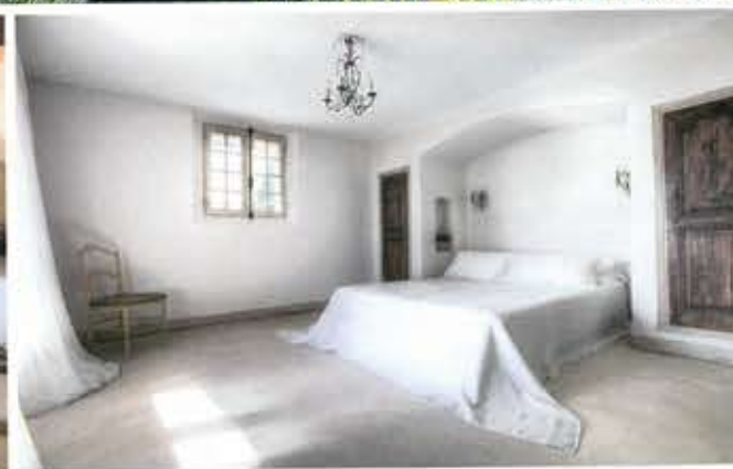
VILLA MOUGINS 1 650 000 €

Cette jolie villa d'environ 200 m 2 est idéalement située à pied du vieux village et des commerces. Orientée plein Sud elle offre un bel aperçu mer. Principalement de plain pied cette villa d'inspiration provençale en parfait état se compose de trois chambres dont une de maître et d'un studio indépendant. Elle dispose d'un beau jardin d'environ 1650 m 2 joliment complanté, avec piscine et garage. • Within walking distance to the old village of Mougins and its shops, charming provençal villa of around 200 sqm, facing south, enjoying open views and sea glimps. Mainly on one level the villa offers 3 bedrooms including a master bedroom and an independent guest apartment. Manucured garden of 1650 sqm with swimming pool and garage. • Ref. MZIMO1873.