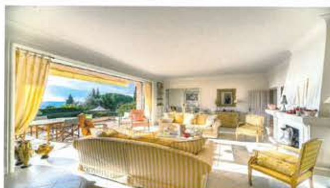
VILLA MOUGINS / VILLAGE 2 200 000 €

Charmante maison de village d'env. 100 m 2 , avec trois chambres, située en cœur du vieux village de Mougins. Rénovée dans un style chaleureux dispose de 2 belles et grandes terrasses orientées plein sud avec vue ramique. • Charming village house of around 100 sqm, with 3 bedrooms, located at the heart of the old village of Mougins. Entirely renovated in a very atmosphere, it offers 2 beautiful and large terraces facing due south with views. • Ref. MZIMO1546