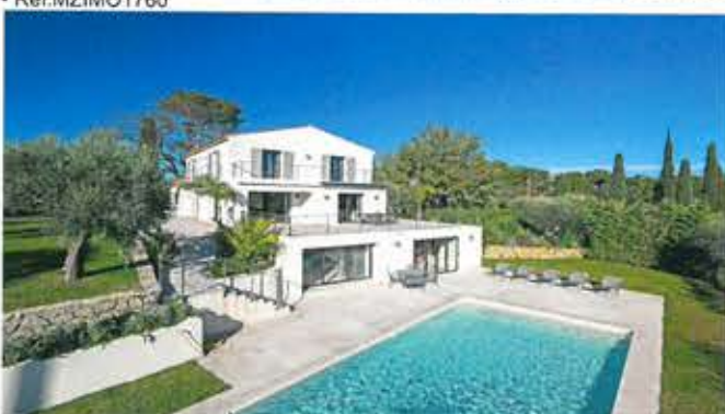
VILLA MOUGINS 2 995 000 €

Propriété pleine de charme composée d'un mas en pierre de plain-pied, d'une maison d'amis et d'une piscine avec pool-house aménagés sur un terrain de 1000 m 2 avec vue sur le vieux village de Mougins. COS résiduel important. • E AGENT. Charming property composed of a stone mas on one level, a guest house and a swimming pool with equipped pool-house. Beautiful view of the old village of Mougins. Important residual building potential. • Ref. MZIMO1765