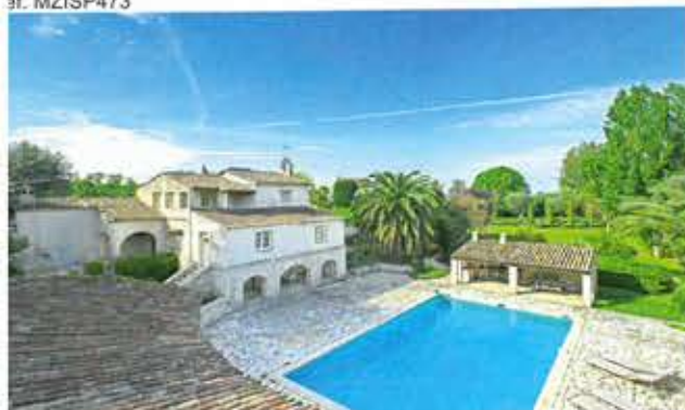
VILLA VENCE 1 395 000 €

Située à proximité du village et au calme cette propriété de style californien bénéficie d'une très jolie vue sur le village de St Paul et la mer. Beaux et lumineux volumes intérieurs avec 5 chambres, piscine, cuisine d'été et maison d'amis. • Located close to the village and in a quiet environment this Californian style property enjoys lovely views of the St Paul village and the sea. Large and bright interiors with 5 bedrooms, swimming pool, summer kitchen and guest house. • Ref. MZISP748