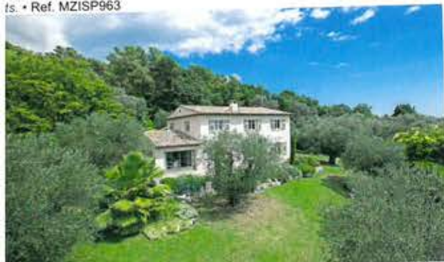
BASTIDE OPIO 1 995 000 €

Superbe villa Belle Epoque en pierre sur 2870 m 2 avec piscine, pool house, reliée au tout à l'égout. Entièrement rénovée, elle offre 7 chambres, 2 pièces indépendantes dans l'appartement d'amis, 2 garages et un parking 10 places. • Superb Belle Epoque stone masonry villa on 2870 sqm of land with pool, pool house, linked to the mains drainage. Completely renovated, it offers 7 bedrooms, independent 2 bedrooms guest apartment, 2 garages and 10 parking spaces. • Ref. MZIOP464