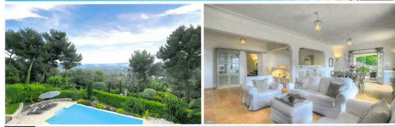
VILLA ST. PAUL DE VENCE 1 995 000 €

Très belle propriété au style résolument provençal, entièrement rénovée et magnifiquement décorée de près de 260 m 2 comprenant 4 chambres ainsi que de grandes terrasses. Joli jardin manucuré avec piscine chauffée et à débordement, barbecue et garage. Située dans un environnement calme, elle est exposée Sud-Ouest et bénéficie d'une magnifique vue mer. • This beautiful property with a truly Provençal style, entirely renovated and decorated with great taste is composed of 4 bedrooms and large terraces on nearly 260 sqm. Nice manicured garden with heated infinity pool, barbecue and garage. It is located in a quiet area and faces south-west with a nice sea view. • Ref. MZISP1054