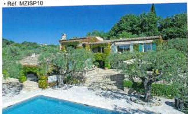
VILLA LE ROURET 1 750 000 €

En position dominante et au calme, villa entièrement rénovée avec des prestations haut de gamme. 6 chambres, 2 salons, Spa, piscine chauffée, très beaux volumes, le tout sur un joli terrain d'environ 3.400 m 2 agrémenté d'oliviers et de palmiers. • On a dominant position and in a quiet area this completely renovated villa offers high quality fittings. 6 bedrooms, 2 lounges, spa, heated pool, large volumes. Beautiful grounds of approx. 3.400 sqm with olive and palm trees. • Ref. MZISP1019