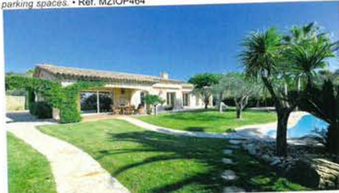
VILLA OPIO 1 750 000 €

Belle villa provençale en pierre, de plain pied et avec vue dégagée, sur 2500 m 2 de terrain et d'olivieraies. A 7 mn de Valbonne village à pied. Garage, piscine chauffée, 5 chambres + studio indépendant, hammam, chauffage au sol, belles prestations. • Stone masonry Provençal villa on one level and open view on 2500 sqm of olive grove grounds. 7 mn a foot from Valbonne village. Garage, heated pool, 5 bedrooms + independent studio, steam bath, underfloor heating, high quality fittings. • Ref. MZIOP459