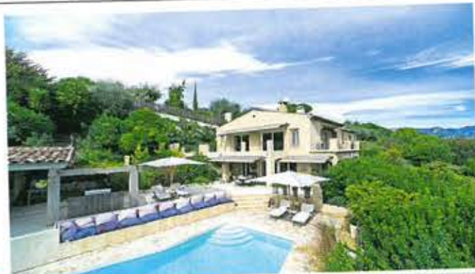
VILLA ST. PAUL DE VENCE 2 300 000 €

En position dominante et au calme, villa entièrement rénovée avec des prestations haut de gamme. 6 chambres, 2 salons, Spa, piscine chauffée, très beaux volumes, le tout sur un joli terrain d'environ 3.400 m 2 agrémenté d'oliviers et de palmiers. • On a dominant position and in a quiet area this completely renovated villa offers high quality fittings. 6 bedrooms, 2 lounges, spa, heated pool, large volumes. Beautiful grounds of approx. 3.400 sqm with olive and palm trees. • Ref. MZISP1019