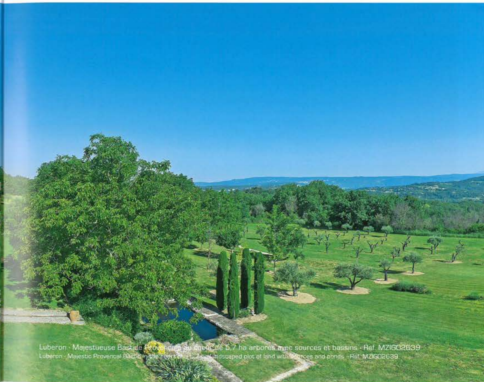
Luberon - Majestueuse Bastide Provençale au cœur de 5,7 ha arborés avec sources et bassins - Ref. MZIG02639 Luberon - Majestic Provencal Bastid in the heart of a 5,7 ha landscaped plot of land with sources and ponds - Ref. MZIG02639